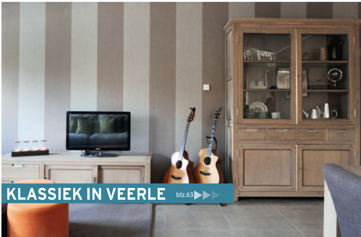
KLASSIEK IN VEERLE blz.63 ▶▶

Al bijna tien jaar worden er meer bouwvergunningen uitgereikt voor appartementen dan voor huizen. Maar naar originele flats is het vaak lang zoeken, omdat projectontwikkelaars daar veelal te weinig oog voor hebben. Toch kunnen ook interieurs van appartementen inspireren. Wij stellen er drie voor.