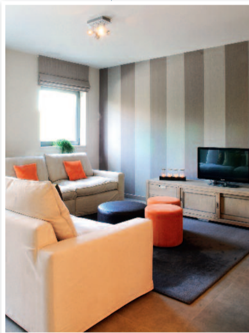
De oranje poefs en kussentjes zorgen voor een opvallende kleurtoets in het neutrale basispalet.