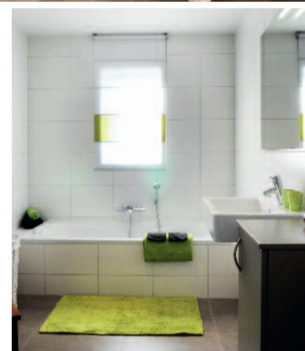
In de badkamer werd gekozen voor fris groen als contrastkleur bij de zachte tinten van de vloer en wanden.