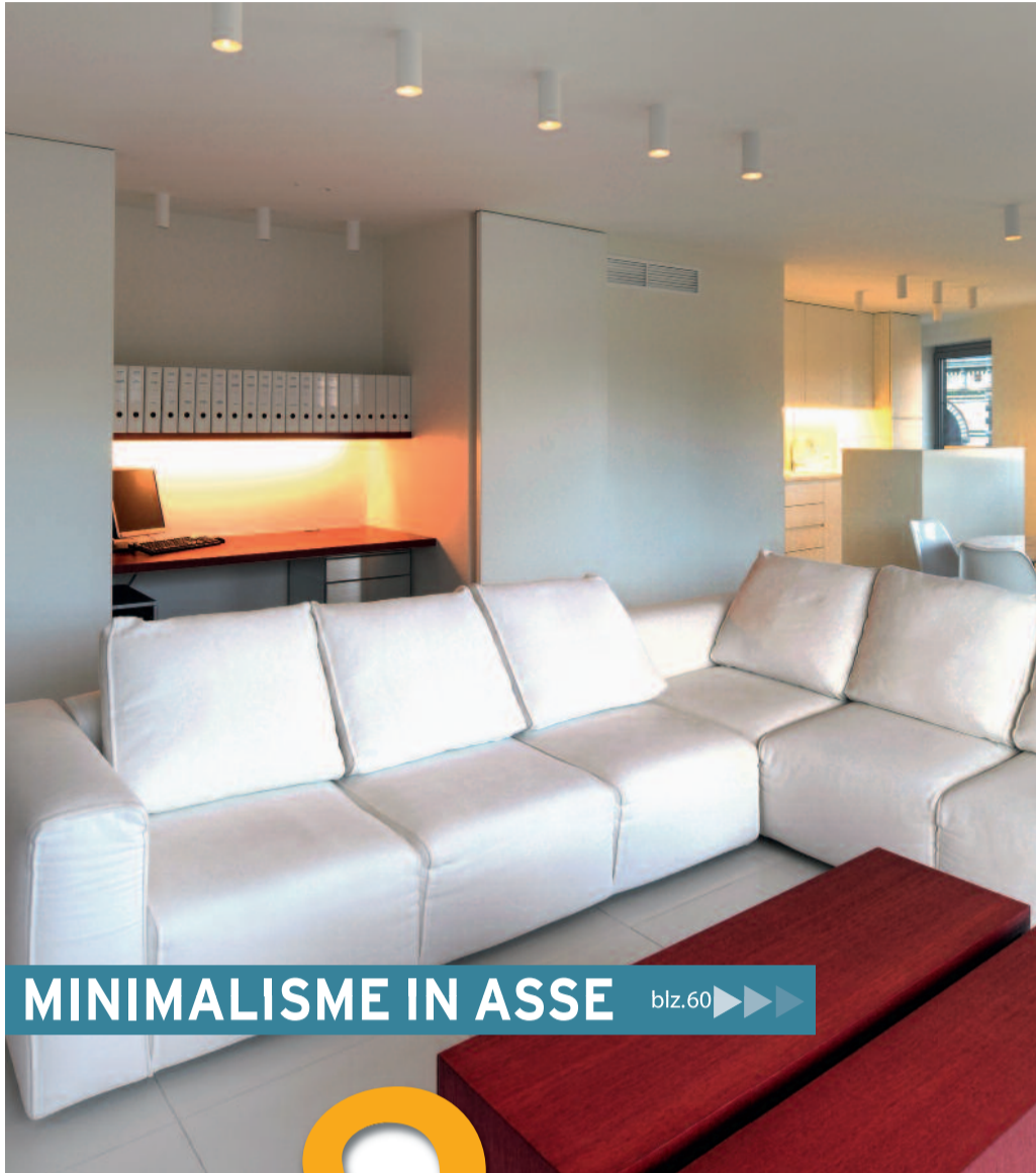
MINIMALISME IN ASSE blz.60 ▶▶