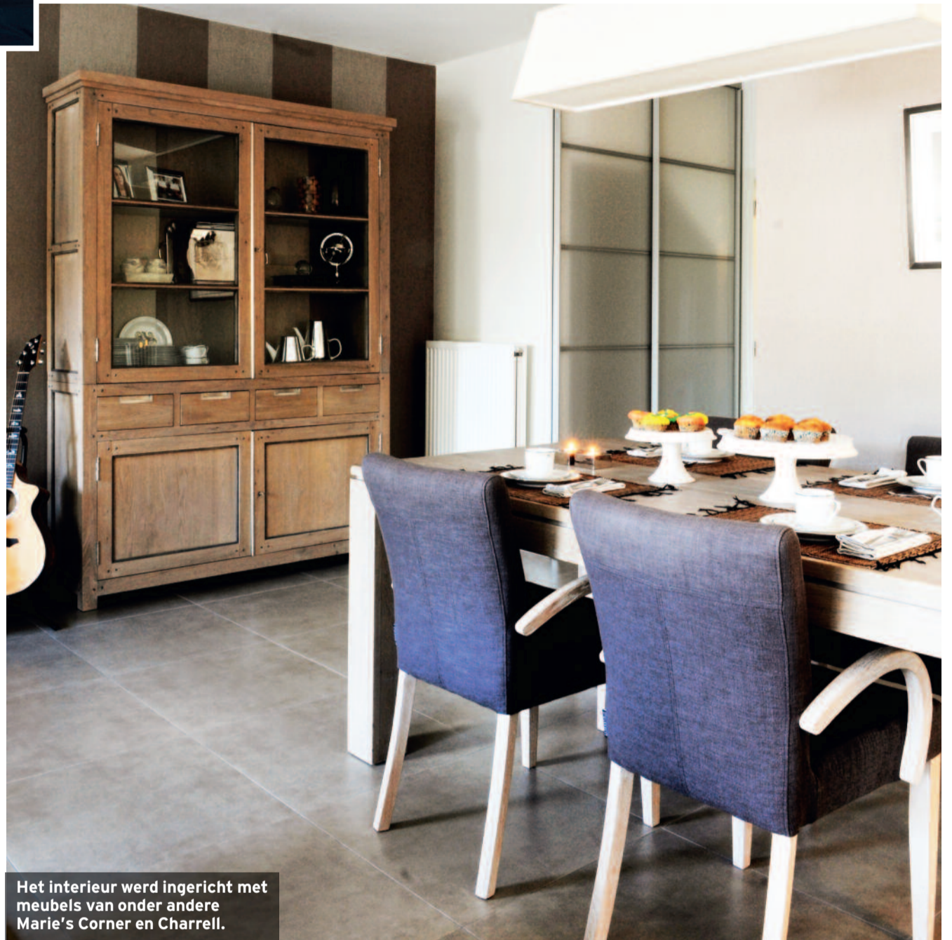
Het interieur werd ingericht met meubels van onder andere Marie's Corner en Charrell.