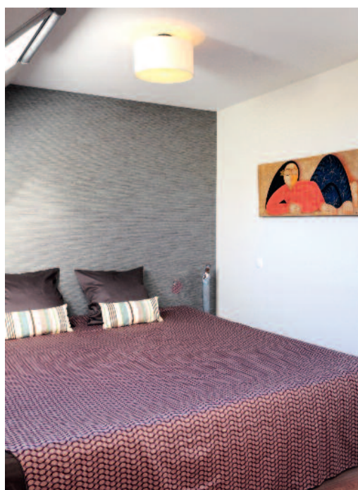
Luxueuze materialen in de slaapkamer: bedlinnen van Chris Mestdagh en strookjesbehang van Arte.

Oppervlakte: 130 m 2 Inrichting: Hilde Van den Bosche, 0474/98 40 46 en www.homefield.be Prijs: sleutel-op-de-deur, incl. keuken en badkamer, maar zonder meubels en decoratie: 1.400 euro/m 2 Behang: slaapkamer Arte (35 euro/lm), eetkamer Flamant (97,85 euro/rol) Meubilair: modulaire poefs in salon (730,50 euro); tapijt van Nash Andrea in 100% wol, maatwerk (1.337 euro) Bloembakken dakterras: polystone, 244,30 euro/stuk