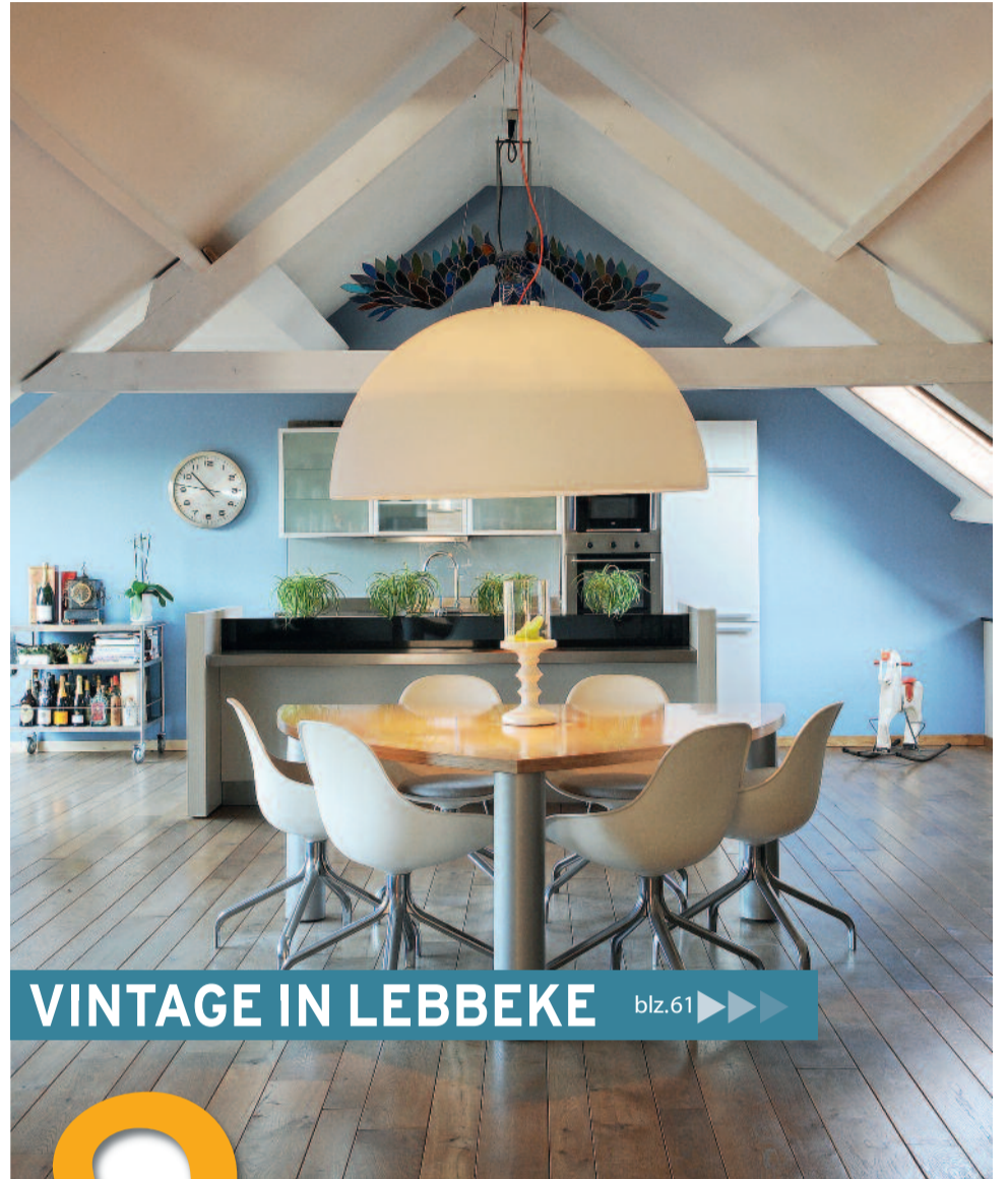
VINTAGE IN LEBBEKE blz.61 ▶▶